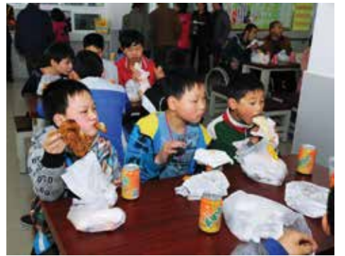
聚餐的氣氛好不熱鬧，同學們吃得津津有味。

蛇年伊始，友愛學校同學們下學年的學習亦隨之而展開。在這新學年，為了向同學送上祝福，鼓勵大家努力學習，「站起來」於3月17日在友愛學校舉行一年一度的聚餐，傷員同學與其他同學聚首一堂，樂也融融。