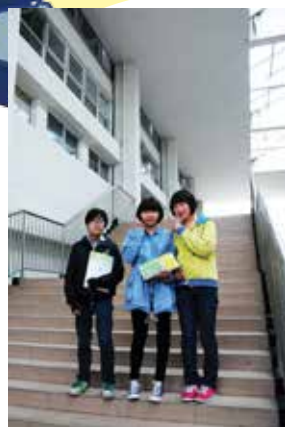
同學們與雲露關係良好，下課後會一齊溫習、下棋等。