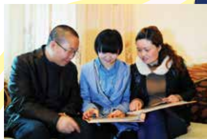
父母和雲露重溫小時候的照片，非常溫馨。