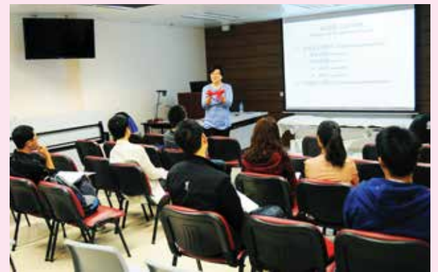
老師教導肩袖肌力量訓練的各種模式。

為四川合作單位高階康復人員提供深造培訓的「高階康復治療深造課程」已於2012年9月及11月至12月舉行兩期培訓，合共14人參加。合作單位對課程的評價非常高，反應勇躍。第三期培訓亦將於4月進行，培訓8名人員。課程著重介紹常見骨科疾病的評估及治療方法，特別是各種新技術的應用，如超聲和肌電診斷在骨科中的應用。