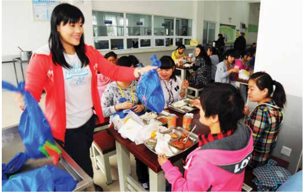
「站起來」大使為同學送上小禮物。

蛇年伊始，友愛學校同學們下學年的學習亦隨之而展開。在這新學年，為了向同學送上祝福，鼓勵大家努力學習，「站起來」於3月17日在友愛學校舉行一年一度的聚餐，傷員同學與其他同學聚首一堂，樂也融融。