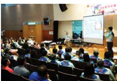
參加者出席簡報會，了解詳細騎單車路線。

「香港單車旅遊會」及「黃禮培慈善基金」自二零零九年地震一周年開始，舉辦一個為期五年的籌款計劃—「港蜀連心單車行」，分段由香港踏單車抵達四川，全程二千三百多公里，籌款目標為港幣一百二十萬元，將全數捐贈予「站起來」，以幫助地震中截肢傷員康復之用。過去四屆，籌款活動已經完成香港至廣州市、廣州市至桂林市、桂林至貴陽市、貴陽市至重慶市四段。