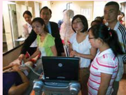
左：老師示範上肢神經傳導記錄方法。 右：學員嘗試做足部超聲解剖。